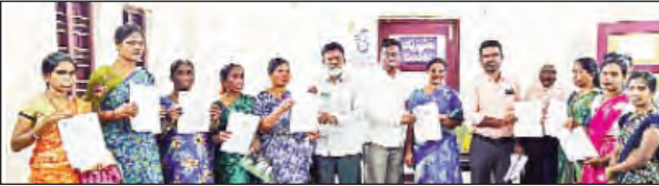
బచ్చన్నపేట, జూలై 17 ప్రభాతవార్త :

అర్ధశతాబ్దాల కుటుంబాలకు గౌరవ సూచకమని ఇందిరమ్మ చేసుకోవాలని ఎంపీడివో మల్లికార్జున్ సూచించారు. మండల పరిధి 26 గ్రామాలలోనూ మ్యూల్స్ వల్ల రాజేశ్వర్ రెడ్డి కి చెందిన 188కి గాను 145 ఇందిరమ్మ ఇళ్ల ప్రొసీడింగ్ మంజూరు పత్రాలను గురువారం లభింపజేసారు. హాజరు గాని లభింపజేసారు ఇళ్ల పత్రాలు పంచాయతీ కార్యదర్శులకు అందజేయాలని సూచించారు. రిజిస్ట్రే అయిన మరొకటి త్వరలో అందజేస్తామన్నారు. ఎంపీడివో లభింపజేసారు వెంటనే బ్యాంకు ఎకౌంట్, ఆధార్, రేషన్ కార్డు జిరాక్సులు సంబంధిత పంచాయతీ కార్యదర్శి కి వెంటనే అందించాలని సూచనలు చేశారు. ఇంటి నిర్మాణం 50 నుండి 60 గజాలలోపు స్థలం ఉండాలని, ఎక్కువ పెంచినచో బిల్లులు ఇవ్వబోమన్నారు. లభింపజేసారు తమ ఇంటి నిర్మాణాలపై ఎప్పటికప్పుడు అధికారులకు తెలియజేయాలన్నారు. ఆర్థిక స్తోమత లేని నిరుపేదలకు మహిళా సంఘాల ద్వారా ఆర్థిక సహాయం అందించటంతో పాటు తహసీల్దార్, ఎంపీడివో ద్వారా ఇసుక కూపస్ అందజేస్తామన్నారు. నిర్మాణ స్థాయిని బట్టి రబీజి రోజే లభింపజేసారు ఇసుక తెచ్చుకోవాలన్నారు. ఈ కార్యక్రమం అనంతరం లభింపజేసారు మాజీ సీఎం కేసీఆర్, జనగామ ఎమ్మెల్యే వల్ల రాజేశ్వర్ రెడ్డి చిత్రపటానికి పెద్ద ఎత్తున లభింపజేసారు క్షీరాభిషేకం చేశారు. ఈ కార్యక్రమంలో పిఎస్ఎస్ చైర్మన్ పులిగిల్ల పూర్ణచందర్, బీఆర్ఎస్ జిల్లా మండల నాయకులు రమణారెడ్డి, చంద్రారెడ్డి, మాజీ ఎంపీపీ నాగజ్యోతి కృష్ణారాజు, మాజీ సర్పంచ్ ల ఘోరం అధ్యక్షులు గంగం సతీష్ రెడ్డి, ఎంపీటీసీల ఘోరమ్ అధ్యక్షులు దూడల కనకయ్య గౌడ్, పిఎస్ఎస్ డైరెక్టర్లు, గ్రామాల అధ్యక్షులు, ఇందిరమ్మ ఇళ్ల లభింపజేసారు పాల్గొన్నారు.