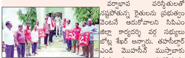
నర్సేట్ల, జూలై 17 ప్రభాతవార్త :