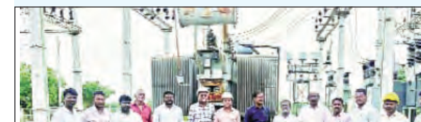
నర్సేట్ల, జూలై 17 ప్రభాతవార్త :